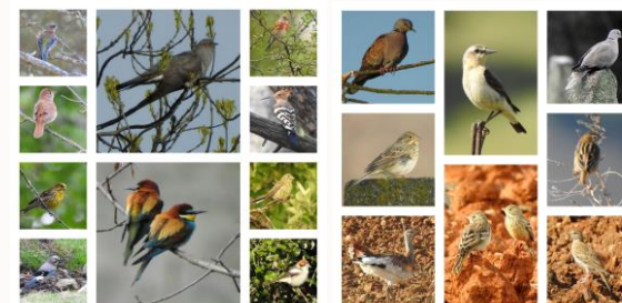
Aves en el encinar