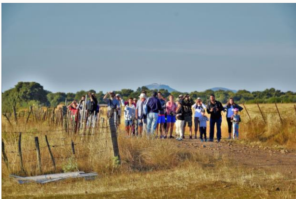
Grupo de excursionistas durante el recorrido por la Ruta Ornitológica de San Muñoz durante el verano de 2018